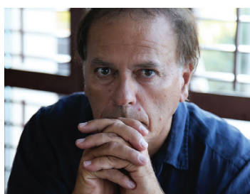
Enki Bilal 2016