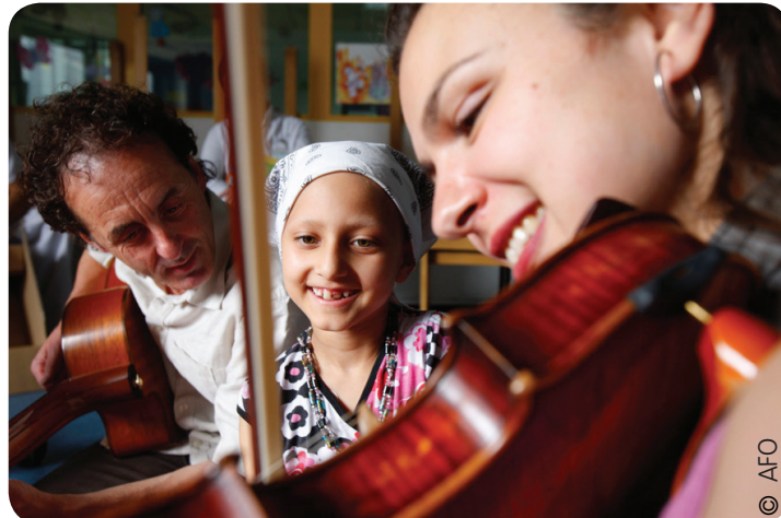
Les musiciens de l'Orchestre National de France au chevet des enfants malades (2008) - action en partenariat avec Musique et Santé