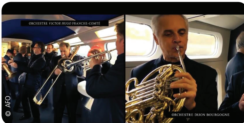
Voyageurs en fanfare (2017) Les musiciens de l'Orchestre Dijon Bourgogne et de l'orchestre Victor Hugo Franche-Comté prennent le train aux côtés des voyageurs