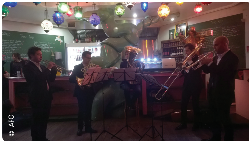
Local Brass Quintet au Rosa Bonheur pour l'ouverture de la 8ème édition (2016)

Vous pourrez entendre successivement les musiciens de l'Orchestre de chambre de Paris et les musiciens de l'Orchestre Philharmonique de Radio France.