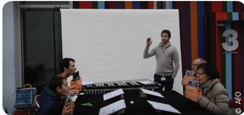
Atelier Beerthoven - Par groupe de quatre, il s'agissait de reproduire le mieux possible l'une des oeuvres de Beethoven à l'aide de bouteilles de bière (2016)