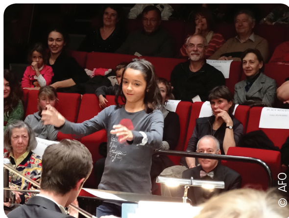
Passage de baguette entre Wolfgang Doerner et une jeune fille pour diriger l'Orchestre de Cannes Provence Alpes Côte d'Azur (2013)