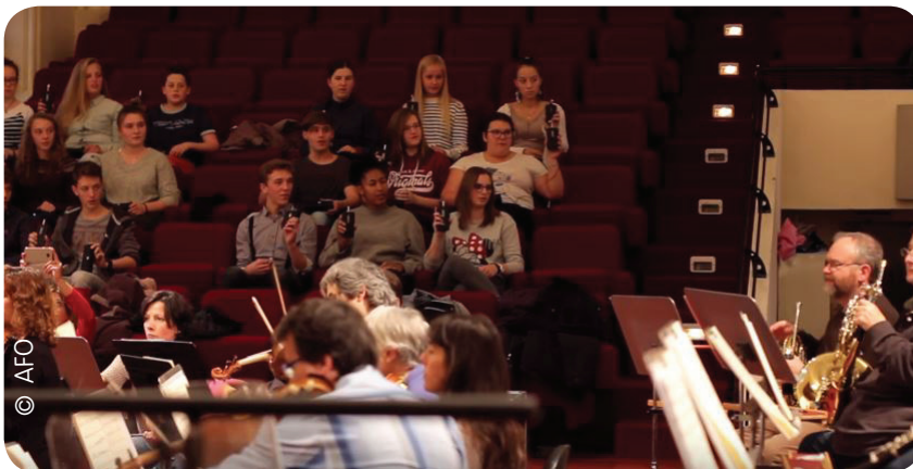
Atelier de travail avec des adolescents pour l'oeuvre participative avec smartphones Geek Bagatelles (2016)