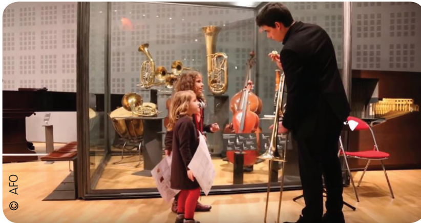
Loto sonore organisé à la Philharmonie de Paris par l'Orchestre Victor Hugo Franche-Comté Atelier ludique pour les enfants pour découvrir les instruments de musique (2016)